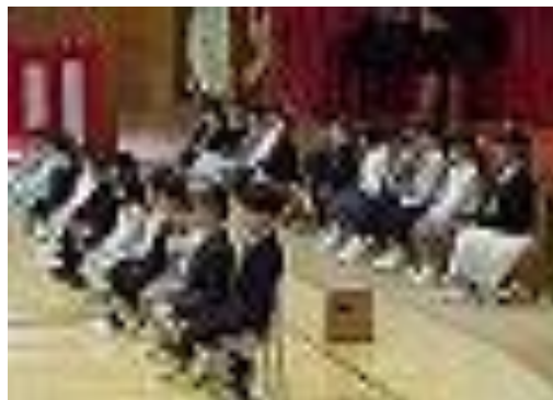
立派な姿勢の1年生（入学式）

今年度も桜の花が満開となった4月7日に、6名の教職員を迎えての新任式及び第1学期始業式を行いました。翌4月8日には、今年1学級編成となった新1年生30名を迎え、入学式を挙行いたしました。全校児童254名で令和8年度を笑顔でスタートすることができました。