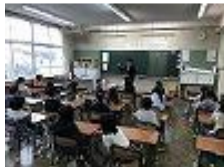
気持ちも新たに授業がスタート

学年が一つ上がった児童が、新しい教科書やノートに自分の名前を書き込む表情は、とても生き生きとしています。ページをめくりながら、「これからどのような学習が始まるのだろう」と、期待と不安が入り交じっている様子もうかがえます。新しい先生との出会いの場も、同様に大切な機会です。今年度は、これまで以上に教師が児童を多角的に把握し、一人一人を最適な学びにつなげていくため、学級担任に加え、学年の教師や教科担任など、年間を通して多くの教師とかわることができる体制を整えてまいります。