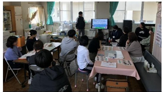
校内研修で考えを出し合う教職員