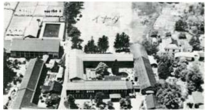
昭和48年100周年時の校舎全景