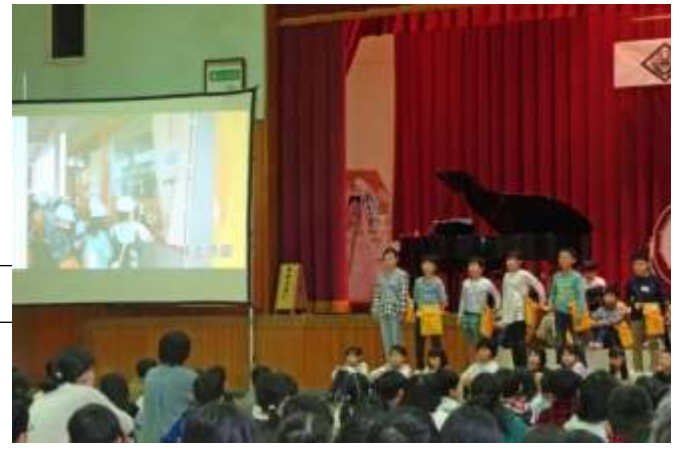
3年生 まち探検や理科の学びを発表する子どもたち