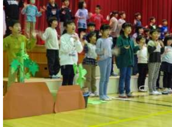
2年生 大きく育つ気持ちを表現します!