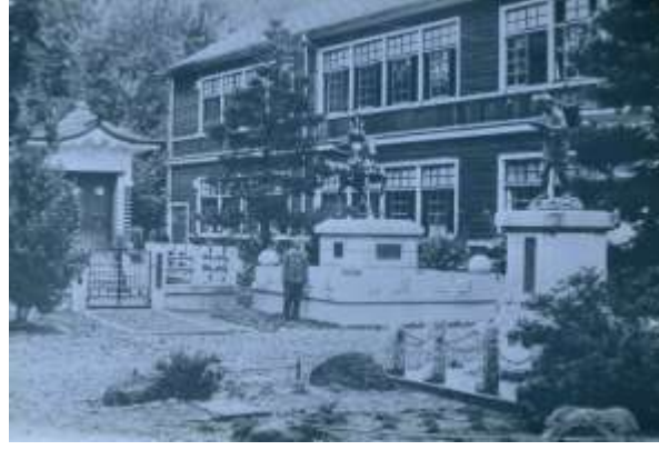
昭和10年代の正面玄関前の様子