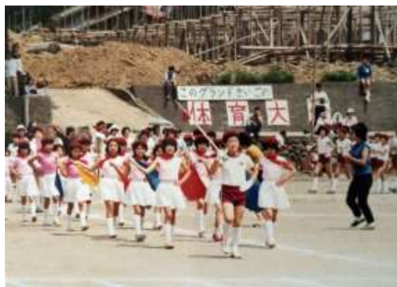
昭和57年旧グラウンド最後の運動会