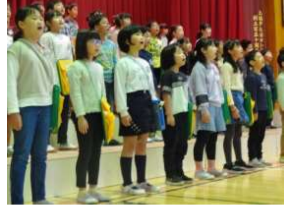
3年生 素敵な歌声で表現します!