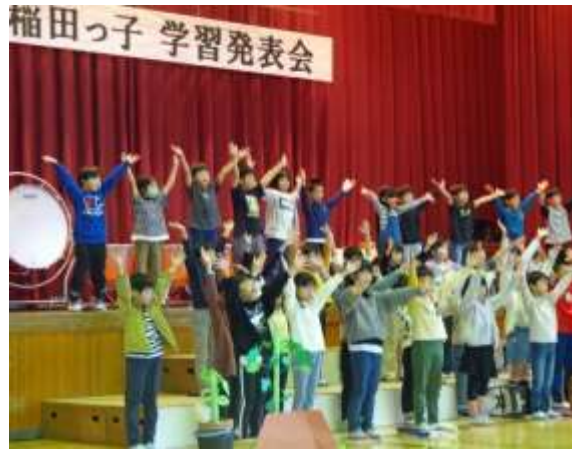
2年生 畑で育てた野菜の成長を喜ぶ子どもたち