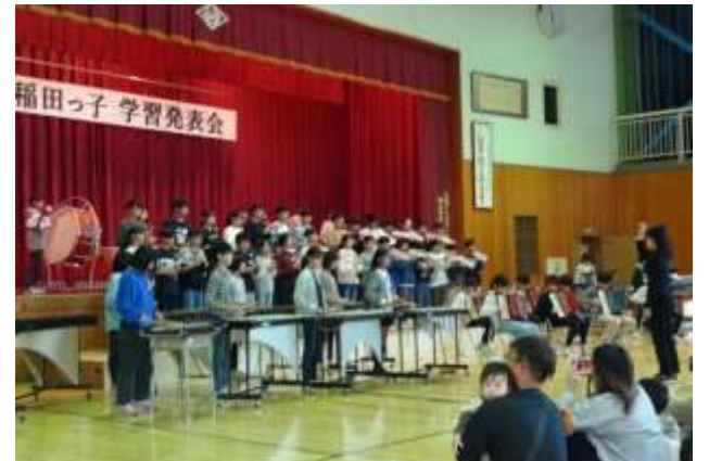
6年生 迫力ある見事なハーモニーを響かせた合奏

上学年になると工夫を凝らした発表や美しい音色の合唱・合奏を披露してくれます。4年生はお客さんにインタビューをしたり、5年生は手拍子をお願いしたりと、会場の皆さんと一体となる演出にも工夫が見られました。特に6年生の合奏は見事でした。