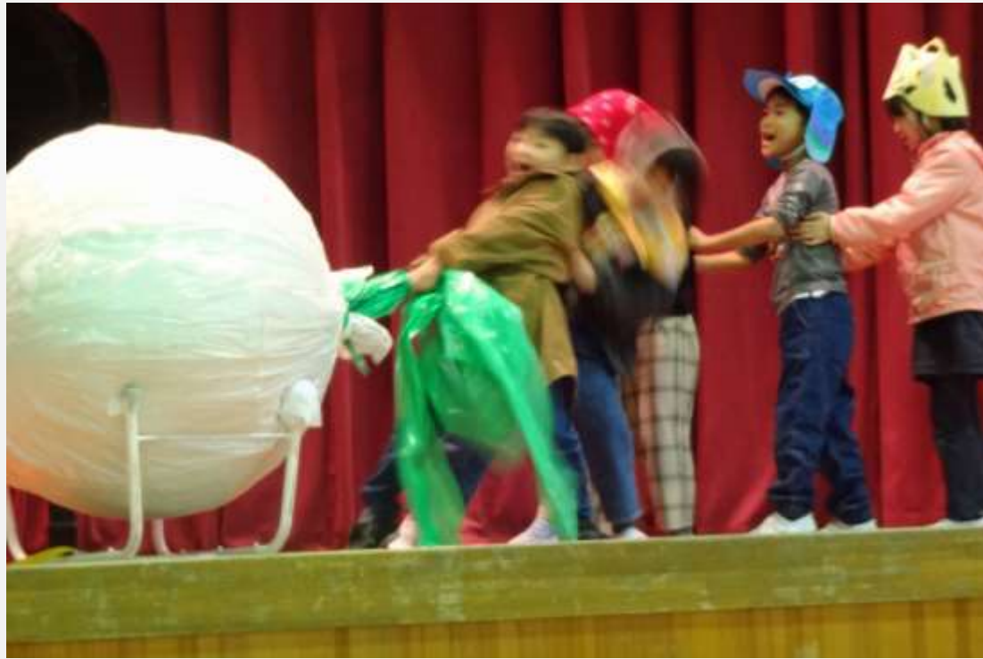
1年生の発表「大きなかぶと小さなかぶ」より

11月3日に「稲田っ子学習発表会」を行いました。当日は、多くの皆様に感謝の気持ちを込めて、全ての学年の子どもたちの姿を見て頂けるような形で開催しました。