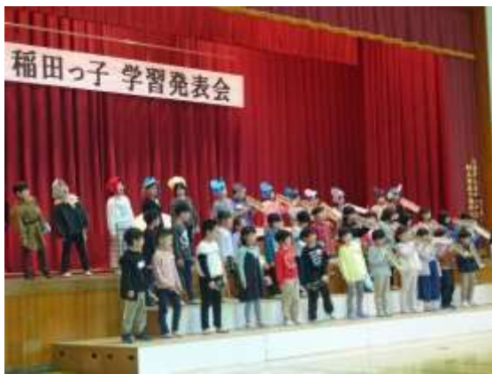
1年生 気持ちを合わせて演奏します!