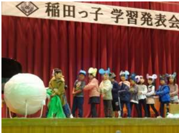
1年生 かぶを抜こうと熱演する子どもたち

4年ぶりとなる鑑賞制限を設けない室内での発表会。これまで学習してきたことを、学年の発達段階に応じて表現しました。1~3年生は、生活科や理科・社会科での学びを音楽と組み合わせ、素敵に表現しました。