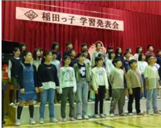
5年生 元気・明るさを歌で伝える子どもたち