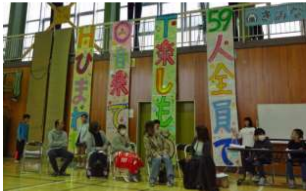
5年生 自分たちのメッセージを垂れ幕に