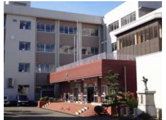
昭和59年現校舎が完成