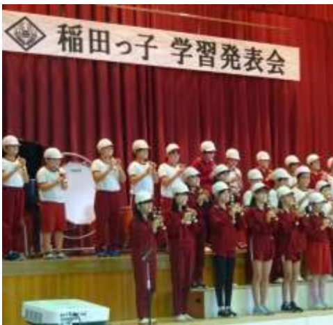
4年生 リコーダーで奏でる素敵な音色