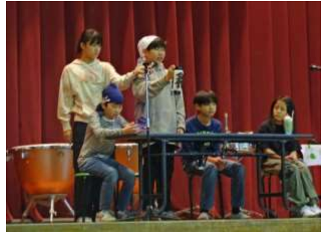
6年生 職業体験で学んだことを表現する子どもたち