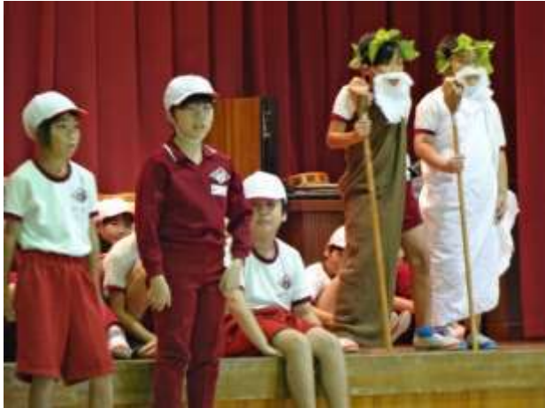
4年生 関川をきれいにとの願いを伝える子どもたち

4～6年生は、主に総合的な学習の時間に学んだことや音楽の学習で練習してきたことを組み合わせて、見事に表現しました。