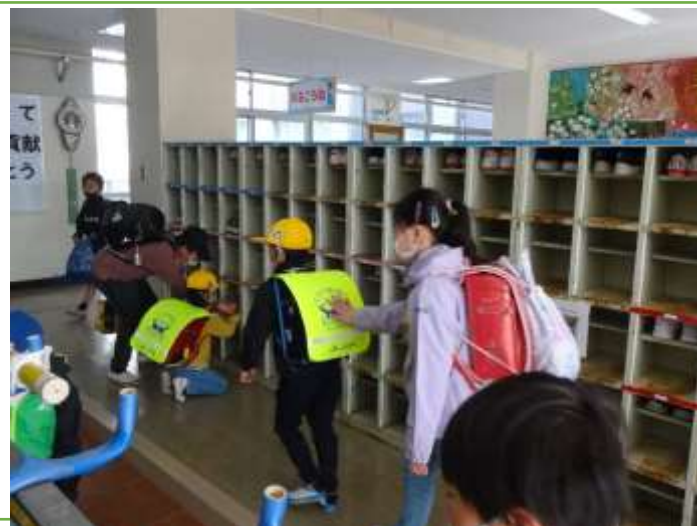
1年生の下駄箱までエスコートする上学年