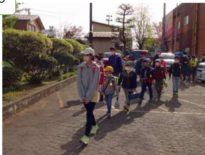
1年生を加えた新登校班での初めての登校