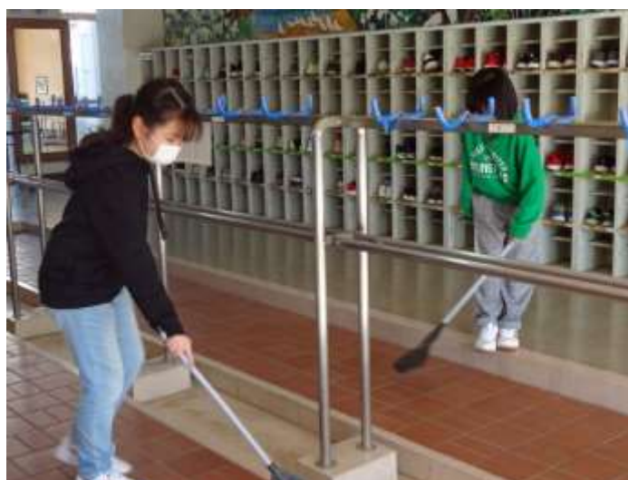
JRC 委員会のボランティア清掃