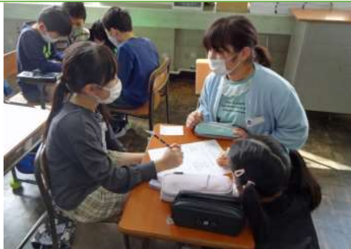
係活動 みんなの役に立つ仕事を考えます