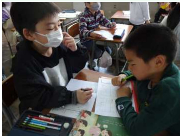
仲間とともに学びあう姿