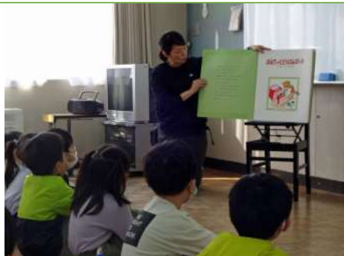
朝の活動 1年生への読み聞かせ