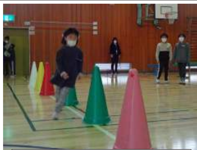
制限時間内にミッションをクリアするぞ