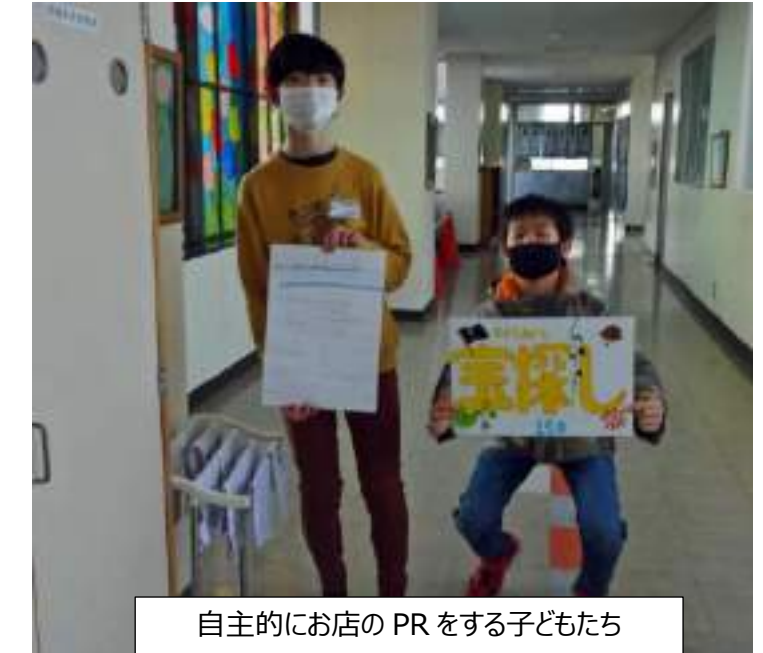
自主的にお店のPRをする子どもたち

○ 稲田っ子フェスティバルは楽しかったです。ぼくは、「150秒間、ボールを守り切れ」のお店でタイマーをかける仕事をしました。そして、タイマーをかけたり止めたりしました。難しいこともあったけど、がんばりました。班のみんなと協力できてよかったです。 (2年)