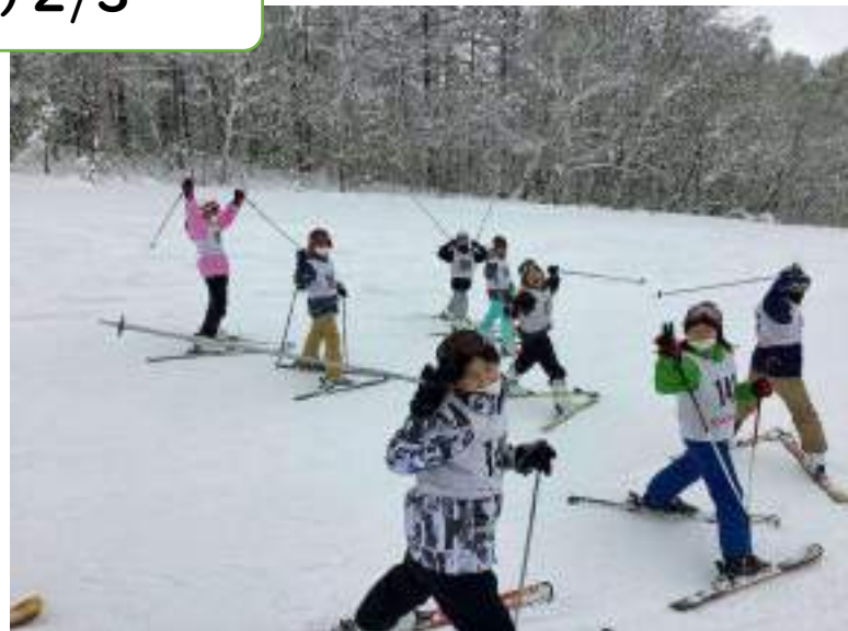
ピースサインでゆとりを見せる4年生