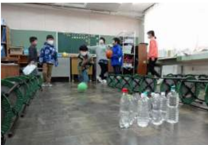
ストライクを狙ってペットボトルピンにGo！