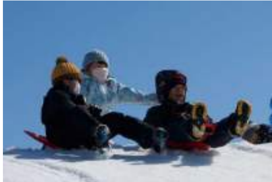
グラウンドと土手で雪遊びを楽しむ1年生