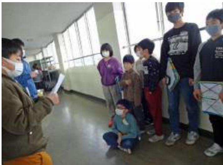
「これから、遊び方の説明をします」宝探しアトラクション前で