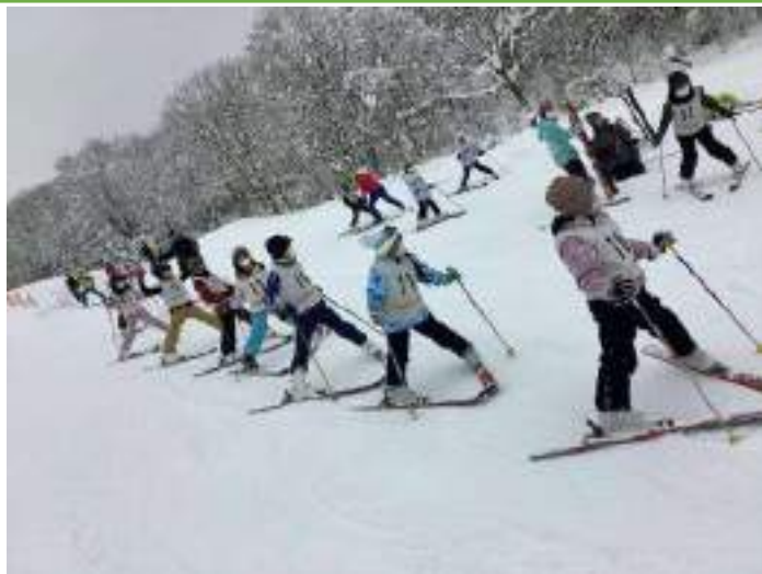
初めてのスキー教室で頑張る3年生