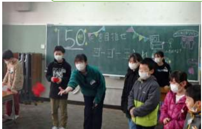
合計得点150を目指して「ゴーゴー玉入れ」