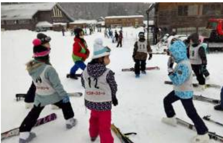
しっかり準備運動をして出発する5年生