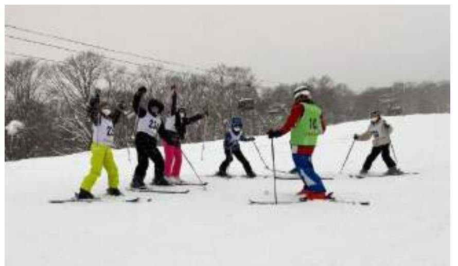
最後のスキー教室を楽しむ6年生