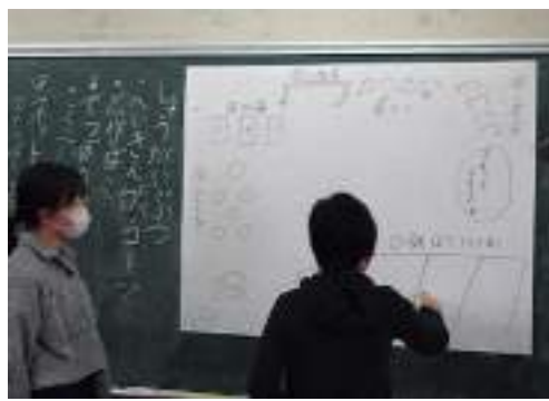
どんなお店にするか話し合い「こんなレイアウトでアトラクションを作ろうか」