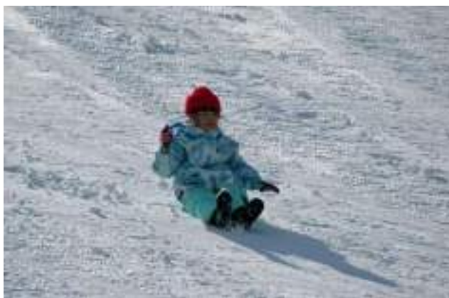
金谷山スキー場で雪遊びを楽しむ2年生