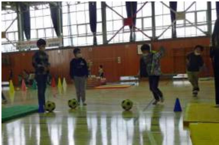
アトラクションを楽しむ子どもたち

🔔 フェスティバル後に振り返りした1～6年生の声を紹介します。学年に応じた、しっかりした振り返りをしている姿に感心します。