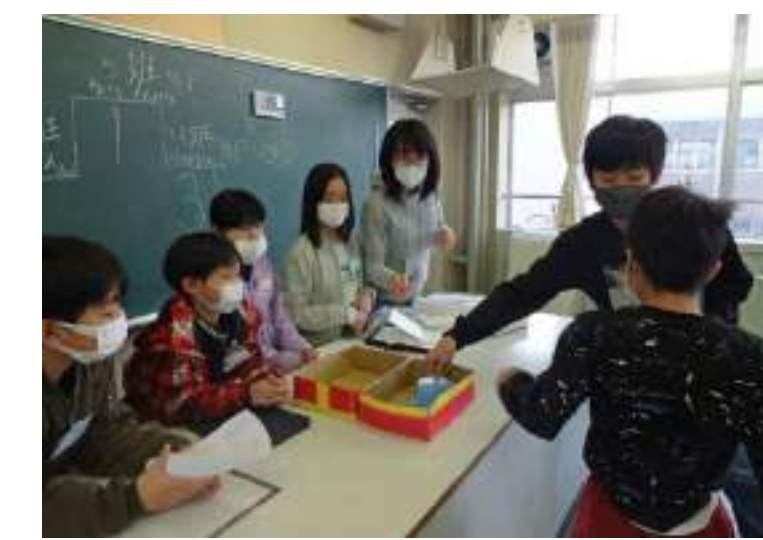
お客さんに楽しんでもらおうと頑張る子どもたち

○ ぼくは、最初に点数を数える役になりました。やってみたら、難しくとても大変でした。だから、先生に教えてもらいました。アトラクションに来る人で数え方が分からない人がいたら教えることができ、他の人の役に立てたと思います。そして自分の役割を果たすこともできました。 (4年)