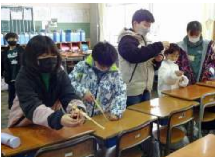
ゴムでっぼう的をロックオン！